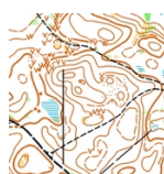
Etap 2 i 3